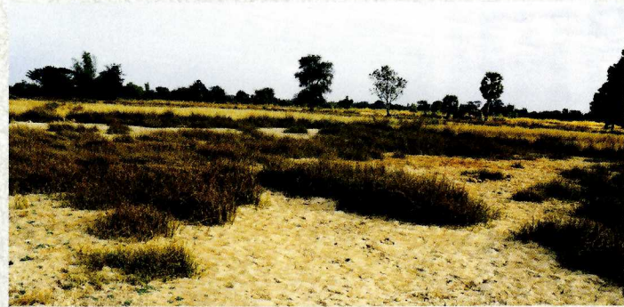
川沿いの低地に自生する プー・ナー(乾季の様子)