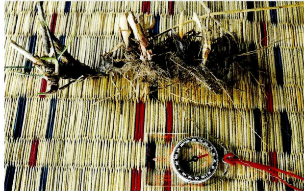
プー・イトックの植栽用の根茎