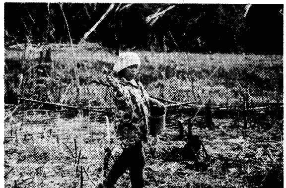
写真3 散播作業中。二次林を開いて4年目の湿地田に乾いた籾をばらまく。

移植に先立ち、畑苗代が9月上旬から中旬に田の周辺やロングハウスから田までの途中の道わきの高みに作られた。苗代設置場所の草木を山刀で刈るかパラコートを撒くかして枯らしてから火入れをし、そこを穿孔棒により穴をあけ、種籾を点播、覆土したあと肥料をばらまいた。本田への移植は、稲が発芽・生育し、苗が30 cm を越える10月中旬から始まり、11月中旬頃にはほとんどの世帯で終わっていた。移植は、長さ1 m 程の穿孔棒を用いて片手で穴をあけ、もう一方の手で苗を一つまみずつその穴に差し込んでいく作業である。植え付けされた苗の苗間は25 cm 程度であった。村びとは、苗代の苗の草丈が高くなりすぎてからの移植は好ましくないと考えており、移植作業はある程度