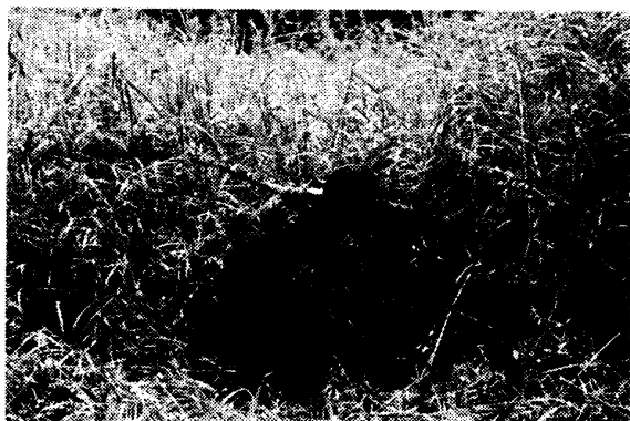
写真1 カヤツリグサ ( Scleria sumatrensis Retz.) 草地：高さ1.5～2.2 m程度、根元直径が5 mm程度の大型多年草が優占する。