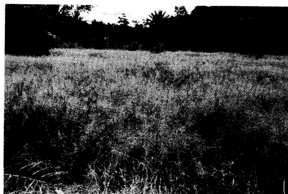
写真2 タイワンアシカキ ( Leersia hexandra Sw.) 草地：高さ50 cm程度で、根元直径が1～2 mm程度のイネ科が優占する。

mm程度、以下、カヤツリグサ)が優占する草地(以下、カヤツリグサ草地)である(写真1)。もうひとつは、エンクロポック enkropok ( Leersia hexandra Sw.) と呼ばれるイネ科のタイワンアシカキが優占する草地である。タイワンアシカキは高さ50 cm程度で、根元直径は1～2 mm程度である(写真2)。また、両種が混在する草地も見られた。 13) カヤツリグサ草地とタイワンアシカキ草地では本田準備の方法が異なるため、草地別にその方法を見てみよう。