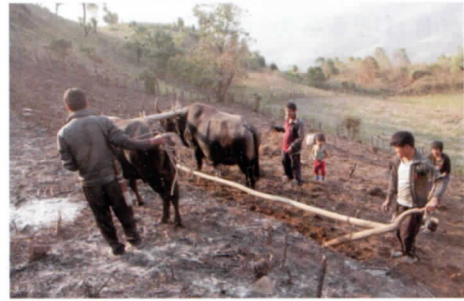
写真4 Monpa 犁