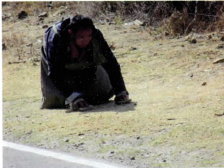
写真13 五体投地をする人、手には草鞋をはめている