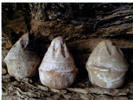
写真 17 ツアツア