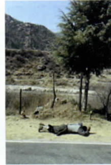
写真12 五体投地をする人