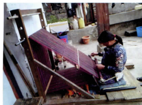
写真 21 機織りは身近な仕事