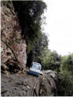
写真 23 崖っぶち