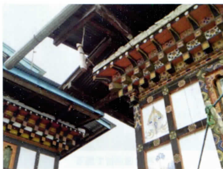
写真 18 屋根の角にぶら下がっているのが厄除け (ポー)