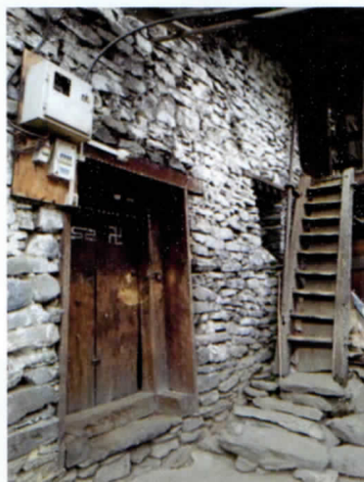
写真 20 石造りの家