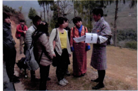
写真10 ガキ村訪問、NGOスタッフの説明を聞く