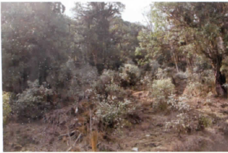
写真3 荒れた森と沈丁花