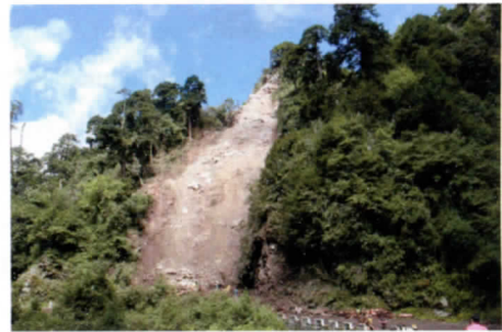
写真 26 地すべり現場