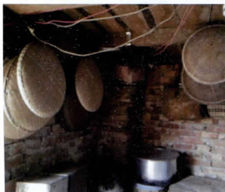
写真 19 台所の竹籠類