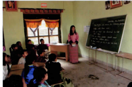
写真8 英語で学ぶ小学生