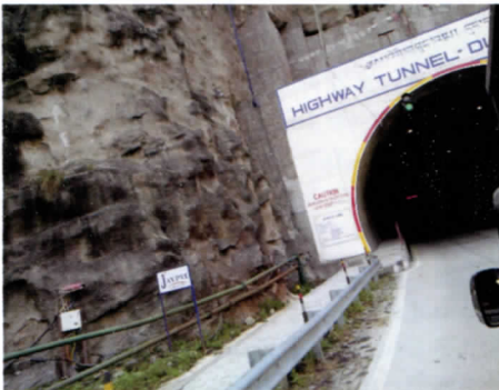
写真7 ブータン唯一の車道トンネル