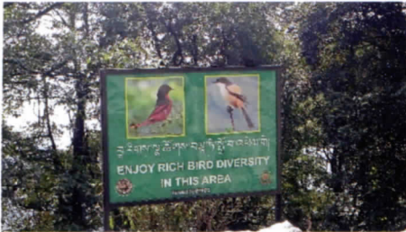
写真5 幹線道路でよく見られる看板