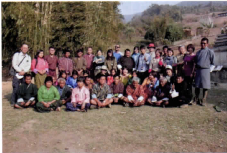
写真11 メンチャリ村での記念撮影