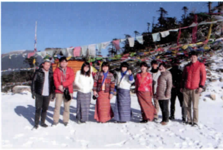
写真1 トウムシン峠での記念写真