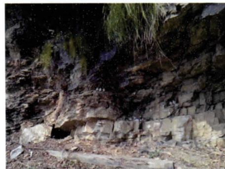
写真16 岩陰にツァツァを