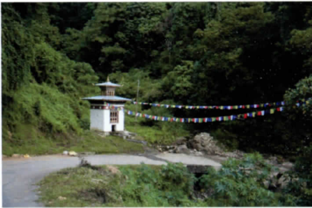
写真 25 マニ水車