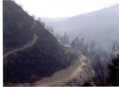
写真 24 山に沿って迂回する道ばかり