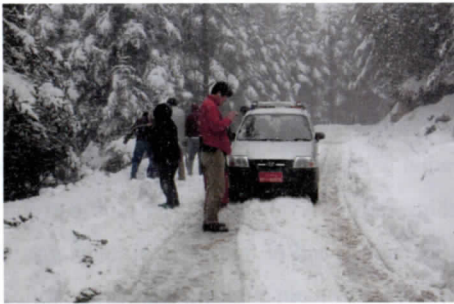
写真 27 激しく降る雪