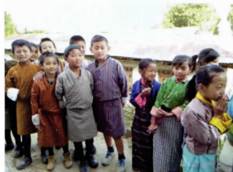
写真 22 ゴ、キラは日常着