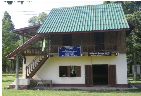
ຫໍພິພິດຕະພັນ, ບ້ານທ່າຈຳປາ