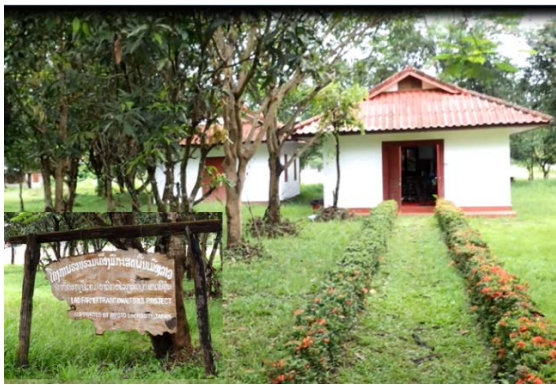
ຫໍພິພິດຕະພັນເຄື່ອງມືກະສິກຳພື້ນເມືອງລາວ, ຄກສ

ໃນເວລາລົງປະຕິບັດຕົວຈິງແມ່ນໄດ້ຮັບການຮ່ວມມືຈາກ ຫໍພິພິດຕະພັນເມືອງຄາເມໂອກາ (ເມືອງຄາເມໂອກາ ແຂວງກຽວໂຕ), ແລະ ສະມາຄົມສົ່ງເສີມເຂດຈີອີ (ບ້ານມີຢະມະ ເມືອງນັນຕັງ ແຂວງກຽວໂຕ) ຢູ່ປະເທດຍີ່ປຸ່ນ, ແລະ ບັນດາອົງການລັດຂອງເມືອງ ແລະ ແຂວງ ເຊັ່ນ ຫ້ອງການປົກຄອງເມືອງໄຊທະນີ ເປັນຕົ້ນ ຢູ່ປະເທດລາວ.