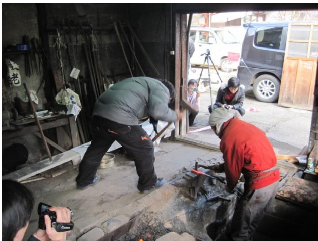
写真 1 鍛冶屋倶楽部の活動の様子 2012年2月16日

これらは、データベース化されて、亀岡市や亀岡市文化資料館に寄贈されることになっている。また、今秋、亀岡市文化資料館において、道具類や鍛冶についての展示会が行われる予定である。この調査研究に加え、鍛冶屋倶楽部は、近隣の農家から譲り受けた鉋などの道具類の静態保存 [3] とともに、それらの道具類を使う技術や修理する技術を継承するための動態保存 [4] にも取り組もうとしている。