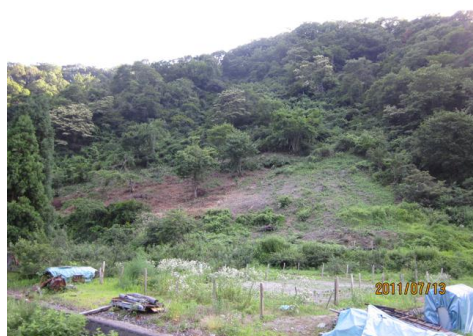
写真中央の立木の左側が今年の火入れ予定地、右側は昨年の焼畑

昨年の焼畑は、ササの火力が強く地表下5cmで110度以上にもなった(ざいちのち23号)ので、ササも雑草もほとんど再生していないが、ササ根は残って土壌を押さえている。今年は、昨年の火入れ地の北側1/3を放置して植生遷移の観察地にし、残りにソバとヤマカブラを、新しい火入れ地にはヤマカブラやダイコンを植える。