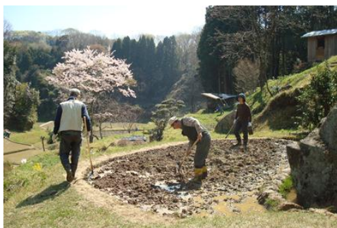
写真1. 大津市の四十九枚棚田の手作業

今は棚田を守るため、沢山のボランティア活動がありますが、手作業が大変なので継続できるのかどうか心配です(写真1)。なぜかという、手作業の農業はとても大変だからです。現在ほとんどの農民は各々機械を持っていますが、機械を使っても耕作地が減少しています。まるで、近代的な農業の維持のために日本の農民は機械を使っているようです。