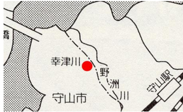
図 1 幸津川・下新川神社

5 月 5 日、守山市幸津川町の下新川神社では「すし切り祭」が行われた。712 年に創始されたこの神社の祭神・豊城入彦命は琵琶湖を