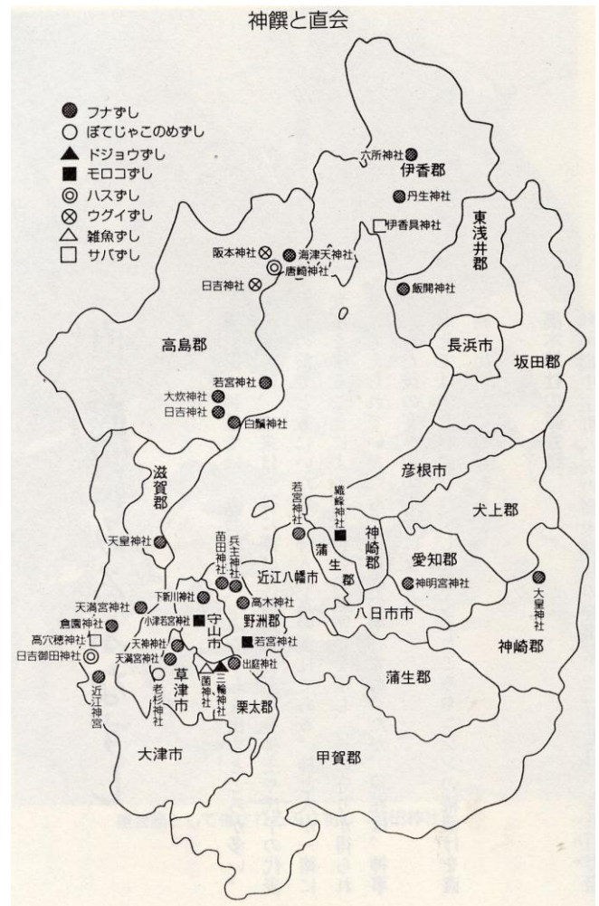
図 2 祭りで使うナレズシの種類と神社

私がフナ以外の琵琶湖在来魚のナレズシをつけ始めたころ、ある人にこう言われた。「いろんな魚を使ったナレズシは淘汰され、フナズシが残ったのだろう。それなのに再度、いろんな魚を使ったナレズシを作って食べようとするのは、文化を逆行させ