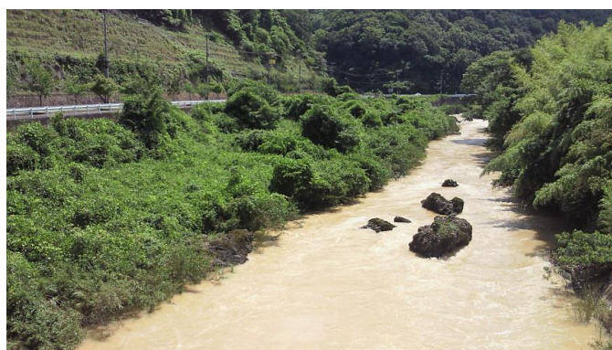
〔写真〕日吉ダムからの放流による濁水。京都府南丹市日吉町小道津にて2010年7月17日 筆者撮影。このときは、1週間以上濁水が放流され続け、漁協なども申し入れを行っている。

また、漁協の組合員からも「川に関係している人たちの中には、補償金の様なものをもらっている関係から、ダムに対しての諦めが先行しているように感じる」（40代組合員）という指摘もあり、こうした巨大な公共事業とそれに関連する補償問題は、事実上の河川管理者としての地位を保ってきていた保津川下りの船頭組織や漁協のレジティマシーを少なからず弱めることとなったといえよう。