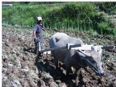
写真2. マニンジャウ湖周辺地域の水牛耕起

水田は、このような多くの価値をもっています。その上、多くの食糧が必要なので、ミナンカバウの住民たちは昔のような水田を守る事ができるので