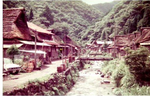
1975年の鷺見川と集落。久保さんの家は右手奥。

私たちが焼畑をしている中河内から、高時川に沿って東南方に下り菅並に出る10kmほどの道路がある。現在落石と丹生ダム建設予定で通行止めになっているが、この間にかつて7集落があり、鷺見はその中間、大黒山から東に流れる鷺見川と高時川の川合にある。近世から昭和40年代までは20戸前後の集落だったが、過疎が進み、平成17年に残った人たちがすべて余呉町に集団移住した。私有林はなく昭和30年代の登記では千町歩余の共有林(滋賀県市町村沿革史、実面積は3千町歩)を有し、もっぱら薪炭業を営んでいた。大正のかかりに近山の使用権だけを割山し、一戸あたり1町~3町の規模で7枚もっている。