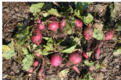
写真 2: 残雪のなかの山かぶら(2009年3月)

昔は、焼畑の作物も冷害対策に組み込まれていた。ことにカブラは、宮崎安貞の『農業全書』に、日照が悪くても育ち、いっぱい食べても体に不具合を生じない優秀な救荒食とされている。今年、そのことを確認するような事態にならないよう、祈るしかない。私たちは、まだ焼畑で雑穀を作ったことがないが、ヒエなどの雑穀は冷害に強く、雑穀栽培地では冷害の深刻な被害を免れてきたと言われている。稲の単一品種の単作でなく多品種栽培、水田だけでなく陸稲や雑穀を栽培する焼畑との組み合わせが推奨される時代になるのは、歓迎したくないが、その準備はしておかなくてはならないと思う。