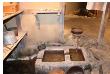
写真: 井戸端のどっこいしょ(上部の丸い円柱)と長方形の 2 層の池(琵琶湖博物館で撮影)。A さんは、琵琶湖博物館で復元されている井戸端在所の井戸端と同じだと言う。

このように開発集落では、野洲川の伏流水をどっこいしょによって生活用水として井戸端で用いた後、同川の湧水から流れる里川に流すという水の循環が行われていた。そして、井戸端の水が流れる里川では、水田や川で獲った魚を飼っていた。このように開発集落における水の循環と利用は、野洲川の水の恵みに基づいており、人々の生活と密接に結びついていたのである。