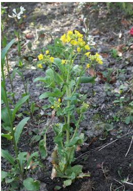
写真 1: 山かぶらの菜の花(2008年4月)

ここ数年、春先に異常に暖かい日が続き、桜の開花が早いのにその後雨と曇りの日が続いて寒くなる天候不順のパターンだった。今年はそれがより極端になっている。異常な天候のせい、うちの庭では例年6月に入ってぽつぽつと咲き始めるドクダミ