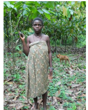
写真2: 亡き夫が遺したカカオ園を案内してくれたバカビグミーの女性

冒頭のシャーマンの言葉を借りれば、ざいちのちとは学ではなく、歌に近いものなのだという気がします。私はまだ、自分が付き合っている人たちが馬鹿にされたり、いとも簡単におカネに騙されてしまうのが悔しくて、情けなくて、もどかしくて、どうにかしたいという私情に駆られているに過ぎません。しかし、私憤なくして公憤なし。この思いと向き合うことが原点だと思っています。