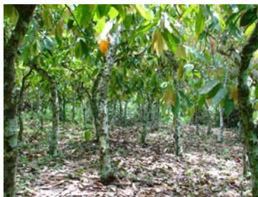
写真1: 森を開いて作られたカカオ園

ところが最近、にわかには換金作物であるカカオ栽培が、生業の比重を増してきました。カカオの国際価格が上がると、町から来たバイヤーによって、わずかな借金の形としてカカオ園の権利が売買されるようになりました。借金の多くは、際限のないお酒の消費に消えてゆきます。そもそも土地に永続的な所有権や利用権を想定したことのない人たちが、借金が重なって、カカオ園ごと外部に土地が流れるケースが数件続けて起こると、村の中に危機感が走りました。